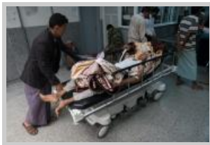
Un paciente con cólera es ingresado en un hospital de Sana'a.

22 de diciembre Después de dos años y medio de conflicto, la situación es crítica en Yemen, donde la escalada de los combates el mes pasado se ha cobrado más víctimas civiles.