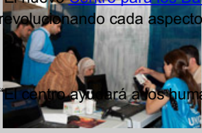
Los trabajadores del ACNUR registran a los refugiados sirios y gestionan su reubicación.

“El nuevo Centro para los Datos Humanitarios de OCHA es un indicador del futuro. Nos muestra como las tecnologías que ya están revolucionando cada aspecto de nuestras vidas se pueden usar para ayudar y apoyar a las personas vulnerables a través el mundo”, dijo Antonio Guterres, el Secretario General, en la ceremonia de inauguración este viernes.