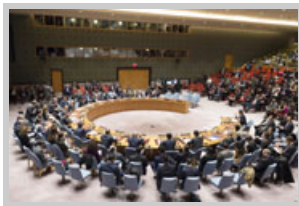
El Consejo de Seguridad en una reunión sobre la no-proliferación en Corea del Norte.