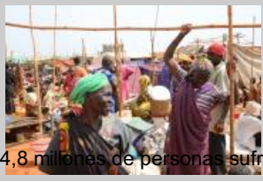
Desplazados de Sudán del Sur en un campamento de Naciones Unidas.

22 de diciembre La misión de las Naciones en Sudán del Sur ( UNMISS ) celebra la firma del acuerdo que establece un cese de hostilidades en Sudán del Sur entre el Gobierno y los grupos rebeldes.