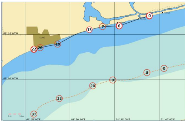
Points terminaux et points pertinents de la ligne de base utilisés pour calculer les limites de la mer territoriale (12 M)