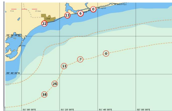
Limite des 24 milles (24 M)