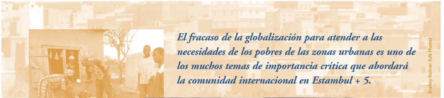
Shelley Rotner (UN Photo)