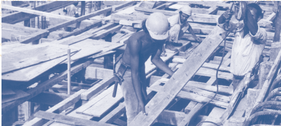
T.Sennett (Photo ONU)