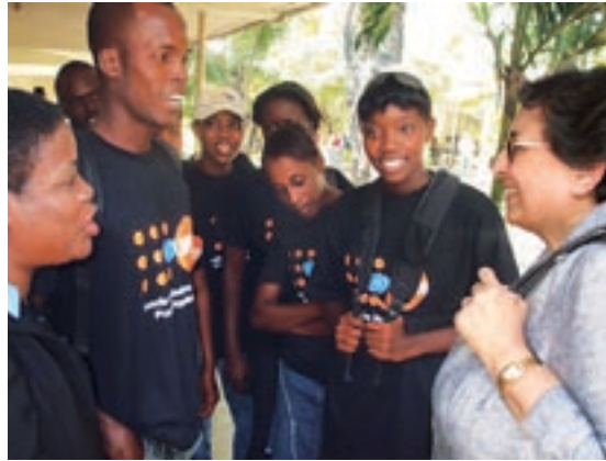
◀ Директор-исполнитель ЮНФПА встречается с молодыми гаитянками, проверяющими уровень недооказания среди матерей и детей, в Центре Гескио в Порт-о-Пренсе в марте 2010 года

Переход от развития к кризису и обратно со всей очевидностью свидетельствует о том, что любые действия по обеспечению развития смягчают влияние кризисов и стихийных бедствий. Эта связь становится очевидной, когда мы сравниваем последствия недавних