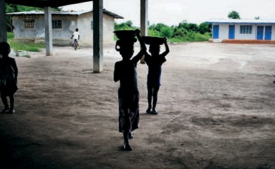
▲ Дети, несущие воду своим матерям на рынке на окраине Монровии, Либерия. На этом рынке, построенном при поддержке ЮНФПА, женщины и их дети ограждены от домогательств и надругательств.