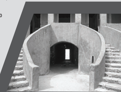
The House of Slaves (Gorée Island, Senegal).

«Ковчег возвращения»: такое название мемориала было специально выбрано в противоположность названию музея «Ворота невозврата», через которые проходили африканские рабы при их отправке на американский континент. Музей находится в Сенегале на острове Горе, который считается самым крупным перевалочным пунктом работорговли на побережье Африки. В 1978 году по решению ЮНЕСКО этот остров был включен в список объектов Всемирного наследия. Он служит напоминанием об эксплуатации людей и храмом для примирения.